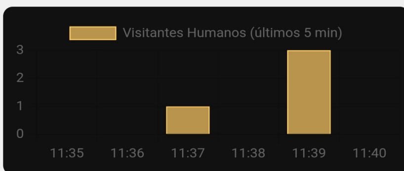
Gráfico mostra apenas humanos. Atualiza a cada 10 segundos.

Interface do plugin Visitantes Ativos Agora — a leitura viva do tráfego humano no WordPress.