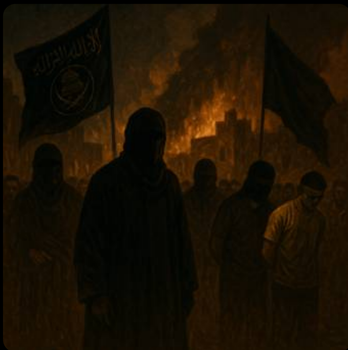
Imagem simbólica — o terror dentro do terror, em Gaza.