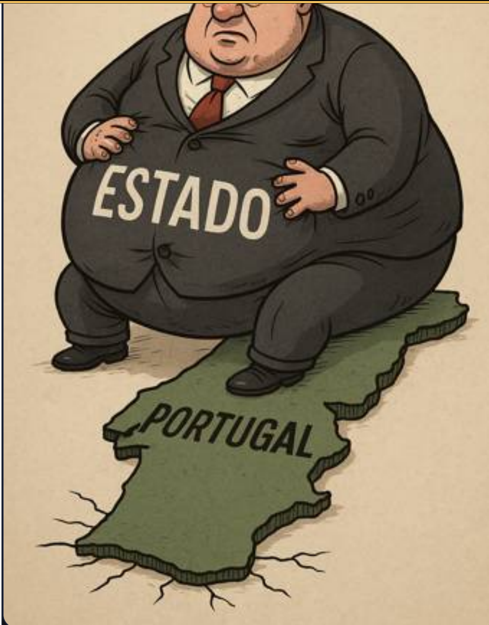
Ilustração: a promessa digital que termina no papel — sátira visual ao “digital de papel”.

A verdade nasce onde o pensamento é livre.